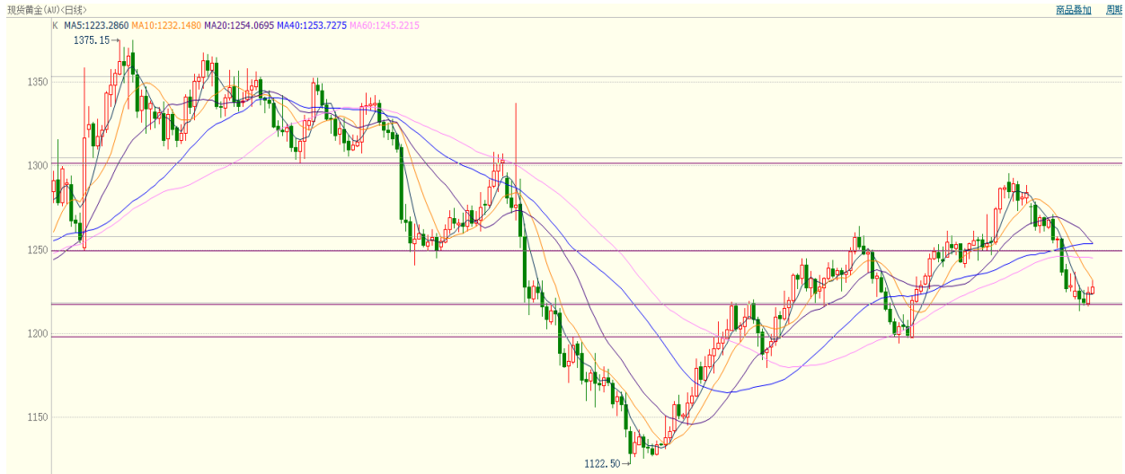
图 7：现货黄金走势图