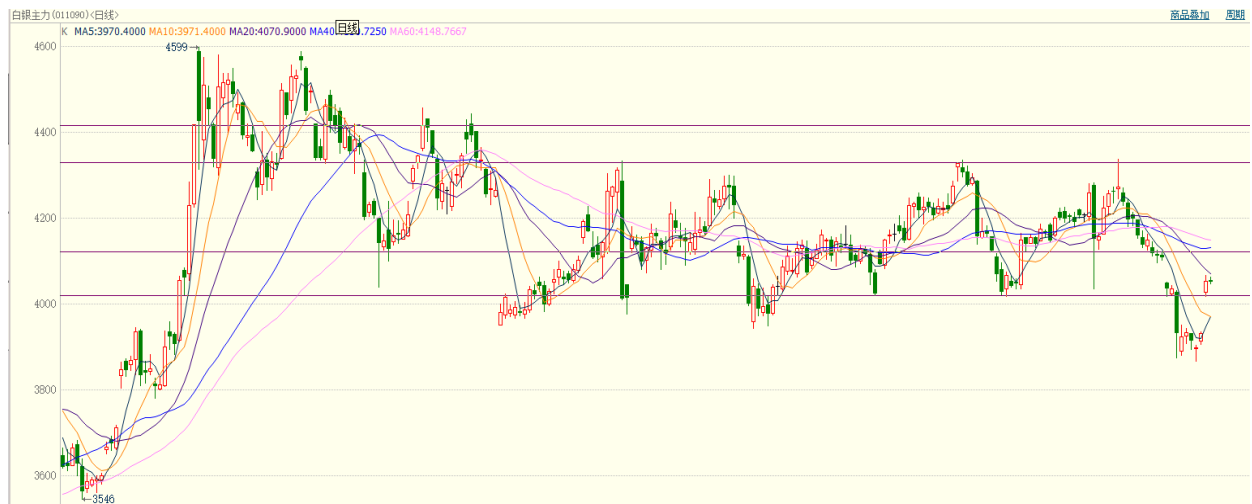
图 10：国内期货白银走势图