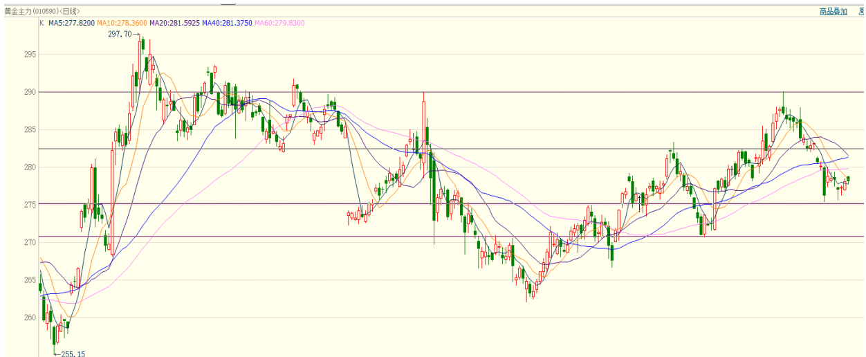
图 8：国内黄金期货走势图