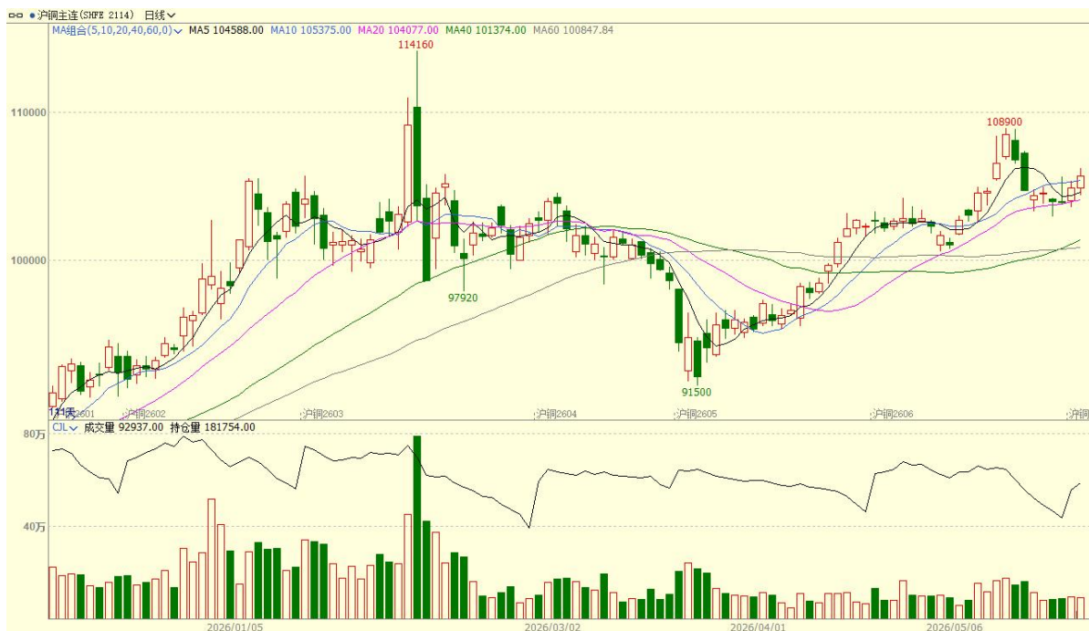
图表 1 沪铜走势

5月铜价先扬后抑，如我们此前预期走出高位震荡行情，行情主要反映宏观市场情绪及预期变化。