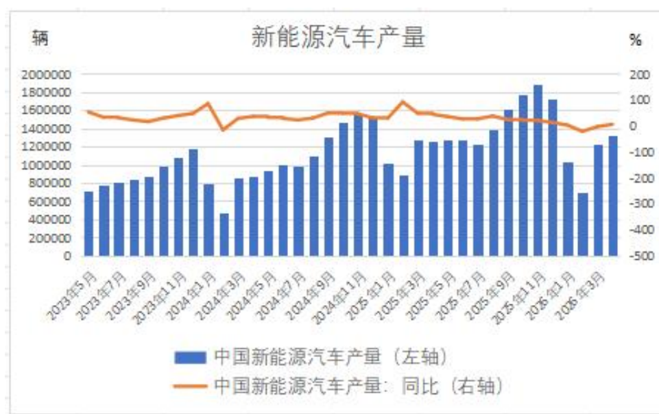
图表 7 国内新能源汽车生产情况

据中国汽车工业协会数据，4 月国内新能源汽车产量同比增长 5.5%至 132 万辆，环比为增长 7.2%；同期新能源汽车销量同比增长 9.7%至 134.4 万辆，环比为增长 7.4%；1-4 月国内新能源汽车产量同比下降 3.2%至 428.5 万辆，新能源汽车销量同比增长 0.1%至 430.4 万辆。