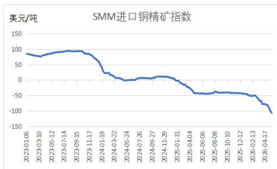
图表 2 进口铜精矿指数

据外媒5月8日报道，自由港已将旗下位于印尼的Grasberg铜矿全面复产时间推迟至2028年初，较此前预期晚一年。