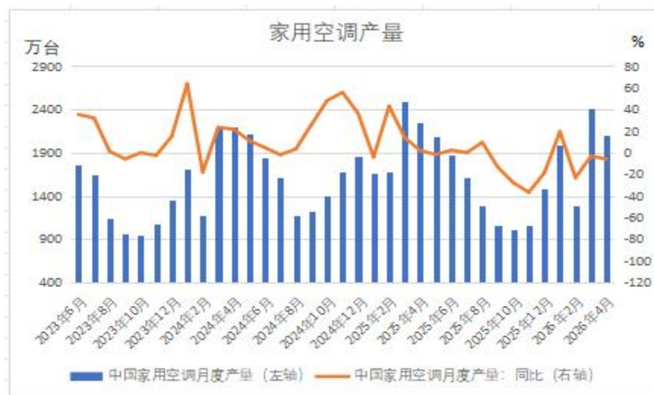
图表 6 国内空调产量

据最新发布的报告显示，2026 年 5 月中国家用场景空调总排产 2197.7 万台，同比上年同期排产下滑 11.7%；其中家用空调排产 2035.5 万台，同比下滑 11.9%，内销排产 1285.5 万台，同比下滑 9.0%，出口排产 750 万台，同比下滑 5.2%。